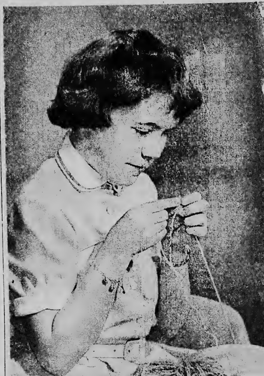
Awe nos Prinses mas hoben, S.A.R. Prinses Marijke, ta cumpli e dichoso edad di dishedos anja, cu cua motibo ta bai pe medio aki nos sinceras felicitaciones na e Princesa y su Real Mayornan.